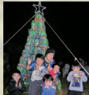
↑昨年12月、デイキャンプで子どもたちとベクトボトルでクリスマスツリーを作った

平成3(1991)年たつの市生まれ。22(2010)年に入学。友人たちと結成したチーム「ジェネシス」の一員として、ボランティア活動に参加している。昨年、兵教大初の体育祭や留学生とのクリスマスパーティーを企画、運営するなど学内にも活躍の場を広げている。