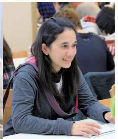
↑あちらこちらのテーブルで会話の花が咲いた