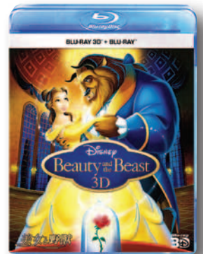
「美女と野獣」 「美女と野獣3Dセット」4,935円 ウォルト・ディズニー・スタジオ・ジャパン