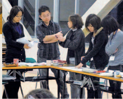
↑立場や経験、年齢の異なる教員同士が「みえ方」を重ね合います

た教員の「みえ方の総体」であるといえます。このような「鑑識眼」は、本来、熟達教員と若手教員が日常的なコミュニケーションを通