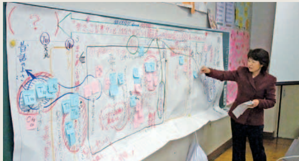
↓授業を固有のストーリー、ドラマとして捉える授業研究会

活動の姿の意味をコンノイサーに解釈しながら適宜必要な働きかけを行っていく実践的な思考の連続であり、一つの授業は「鑑識眼」が発揮され