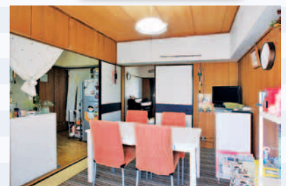
間取りは3K。光ファイバーが完備されているので入居してすぐネットがつながりました