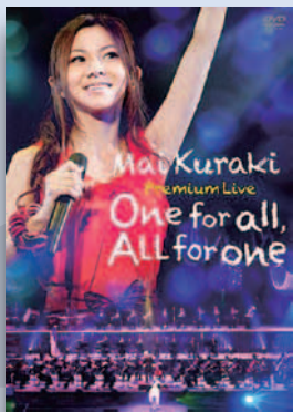
倉木麻衣「Mai Kuraki Premium Live One for all, All for one」 ノーザンミュージック 6,500円

今年3月、倉木麻衣さんの東日本大震災復興のチャリティーライブを収めたDVDが発売されました。Jリーグのチャリティーマッチで国歌を斉唱するなど、彼女が取り組んできた支援活動の中で、このライブは最も規模の大きなものでした。 DVDは2枚組みで全28曲を収録。特に、困難なときにも希望を持ち続けることの大切さを歌った「always」、チャンスは誰にでも訪れるというメッセージが込められた「chance for you」が好きです。皆さんもぜひ一度見てみてください。