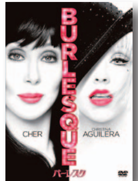
「バーレスク」 DVD発売中 1,480円(税込) 発売・販売元／ソニー・ピクチャーズ エンタテインメント