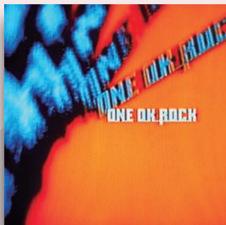
ONE OK ROCK 「残響リファレンス」 発売元/A-Sketch

日 常に疲れて倒れそうになつた時、私たちはよく大切なことを忘れてしまいがちです。ONE OK ROCKのアルバム「残響リファレンス」に収録されている「Chaos.m.y.th.」は、私にこの大切なことを思い出させてくれる、夢や力にあふれる歌です。「Show is beginning curtain has risen. Make your own storyline. Dream as if you will live forever. And live as if you'll die today.」。人生の始まりは今から。大きな夢を見て、今この瞬間、今この場所で生きていくことを歌っています。皆さんもぜひ聴いてみてください。