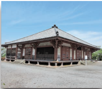
浄土寺浄土堂 小野市浄谷町2094