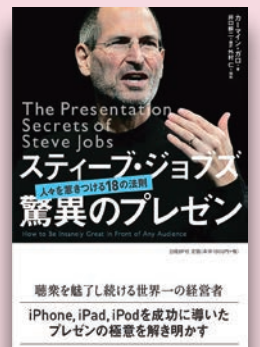
カーマイン・ガロ 「スティーブ・ジョブズ 驚異のプレゼン」 日経BP社