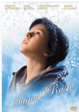
「奇跡のシンフォニー」 DVD ¥3,800(税抜) ※平成28(2016)年10月現在 発売元/東宝東和

心に残る映画、つい口ずさむ音楽、 行きつけのスポットや思い出の一冊。 みんなにも薦めたい私のお気に入りを紹介。