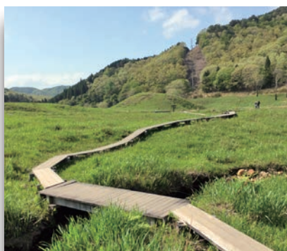
砥峰高原 神河町川上801