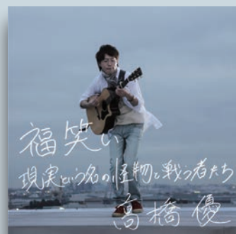
高橋優 「福笑い／現実という名の怪物と戦う者たち」 発売元/ワーナーミュージック・ジャパン