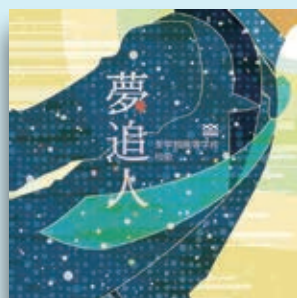
KOKIA 「夢追人」-至学館高校校歌(学園歌) 発売元/アトム・ミュージック