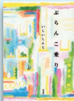
いいしんじ 「ぶらんこ乗り」 理論社