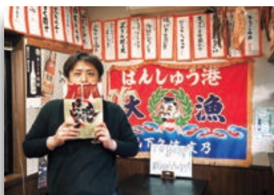
ばんしゅう港 加東市上滝野2347 ☎0795-48-0255 15:00~24:00(ラストオーダー23:00) 不定休