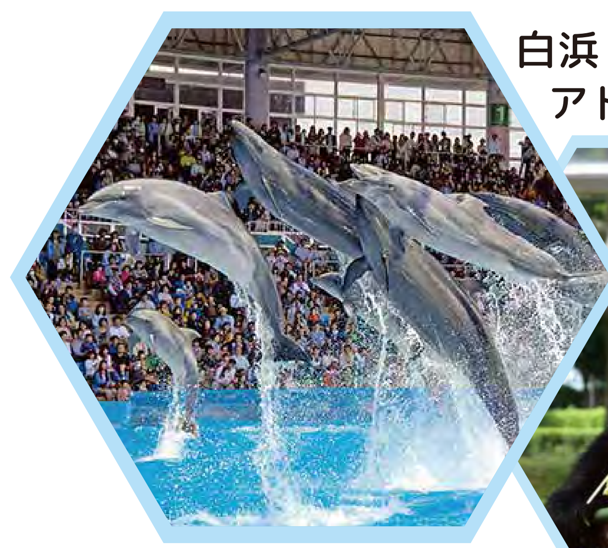
白浜 アドベンチャーワールド