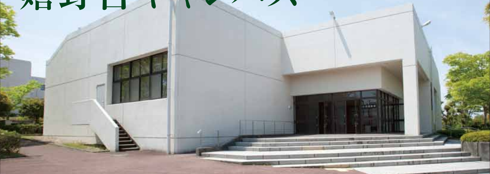
HYOGO UNIVERSITY OF TEACHER EDUCATION Ureshinodai Campus