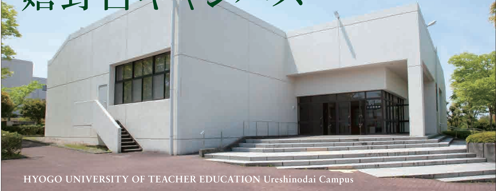
HYOGO UNIVERSITY OF TEACHER EDUCATION Ureshinodai Campus