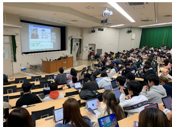
受講する学生の様子