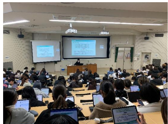
興味深くご講義を聴く学生の様子