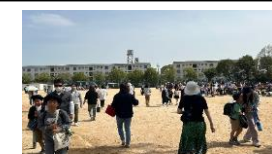
引き渡し訓練ご協力ありがとうございました