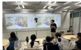
フィンランドとのオンライン交流