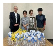
イエローシートキャンペーンで頂きました