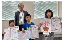
6/6 表彰式おめでとう