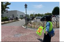
6/1 生活部さん駐車場整理