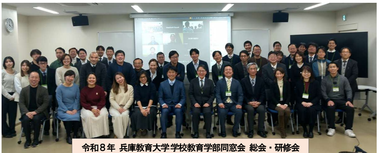
令和8年 兵庫教育大学学校教育学部同窓会 総会・研修会