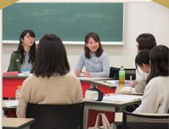
就職対策強化研修

兵庫教育大学での学生生活はいかがでしたか？大学での経験・学びを糧に、これからの新たな生活へ一歩踏み出してください。今回の卒業記念号では、これから社会へ飛び立つみなさんに、キャリアセンター教職員からのお祝いのメッセージをお送りします。キャリアセンター一同、みなさんの未来を応援しています。