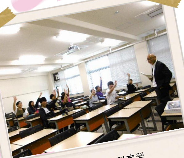
教師力養成特別演習