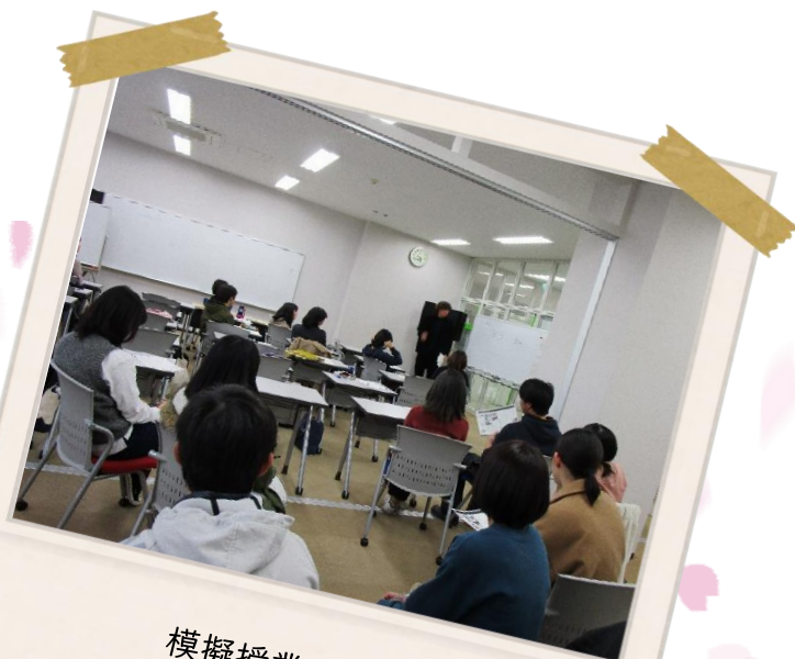
模擬授業特訓講座