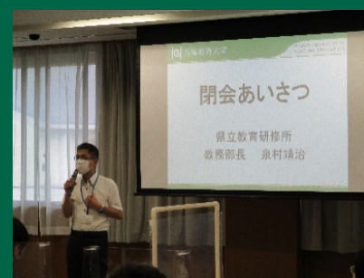
(研修所の方の挨拶)

8月18日は、本学において対面型で実施しました。本研修はオンライン双方向型、オンデマンド型(DVD視聴)、対面型を組み合わせることで、学修の効果を高め、受講・運営の負担を改善することを目指しています。