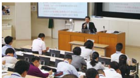
▲学校管理職・教育行政職特別研修(ニューリーダー特別研修)