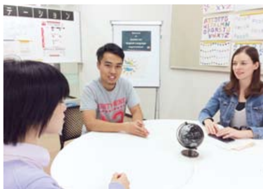
▲英語力向上ステーション

兵庫教育大学では、学部学生が小学校教員になるための英語力の向上を目指し、「英語力向上ステーション」を開設しました。本ステーションでは、英語力向上を目的とした学生が気軽に訪れ、英語に接することが可能となるだけでなく、本学のグローバルゼーション並びに英語力向上のための各種事業の拠点として、TOEICや英語検定等の受験対策講座や、留学生やネイティブ講師との「Eigo de ランチ」等、英語力向上に関する様々な活動やイベントを実施しています。