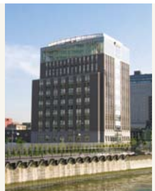
▲大阪大学中之島センター

さらに、同センターに入居する大学として他の入居大学との連携を図りながら、地域社会に対して教育研究成果の還元や情報発信を行っていくことも重要な使命として位置づけています。