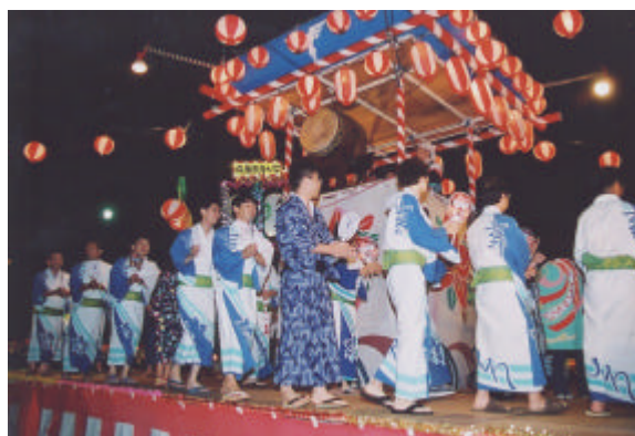
やしろ夏のおどり (関連記事 11頁掲載)