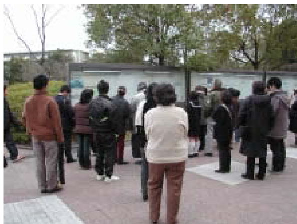
学部推薦入試合格発表風景