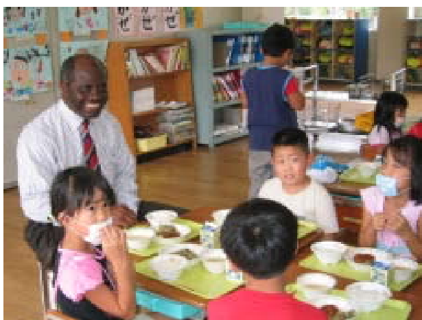
ガーナの教育・スポーツ省関係者の来訪 (関連記事 6ページに掲載)