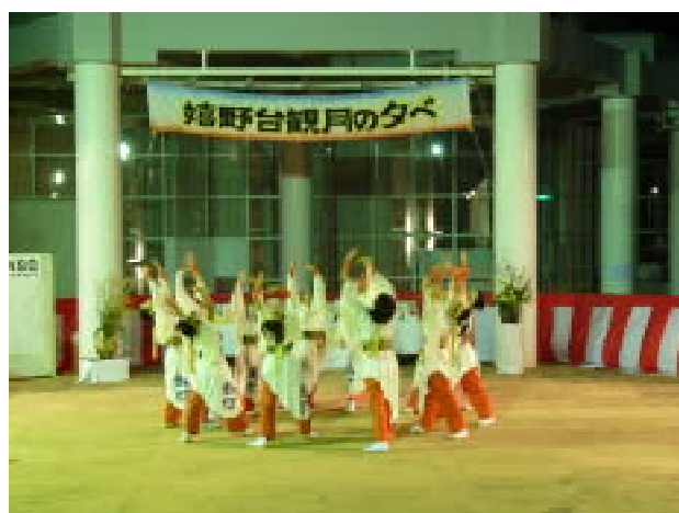
観月の夕べ(関連記事 8ページに掲載)