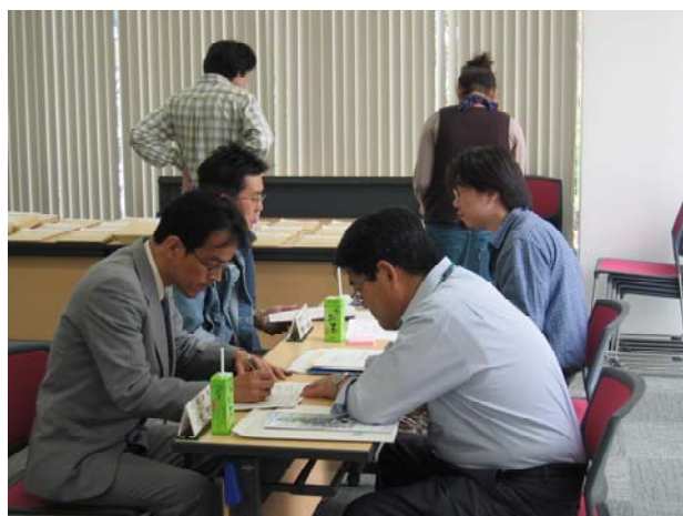
大学院説明会（キャンパス・イノベーションセンター東京地区）の開催（関連記事 6 ページ）