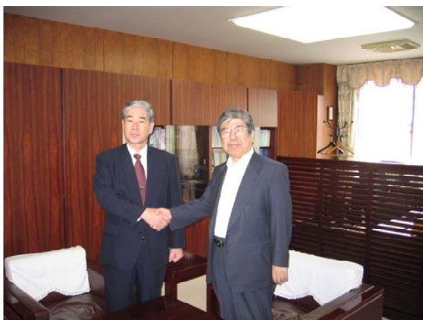
兵庫県立高砂南高等学校との「高大連携教育」に関する協定書に調印（関連記事 5 ページ）