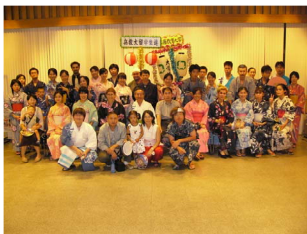
全学レクリエーション「夏のおどり」（関連記事 5 ページ）