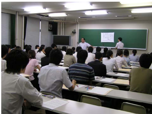
大学院修士課程入学者選抜試験（関連記事 3 ページ）