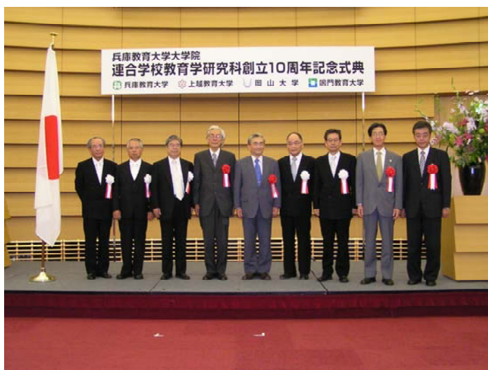
連合学校教育学研究科創立10周年記念式典（関連記事 9 ページ） （左から、岩田研究科長，千葉岡山大学学長，梶田学長，鷺山東京学芸大学学長，辰野大臣官房審議官，高橋鳴門教育大学学長，渡邊上越教育大学学長，大原兵庫県知事代理，中岡大学振興課長）