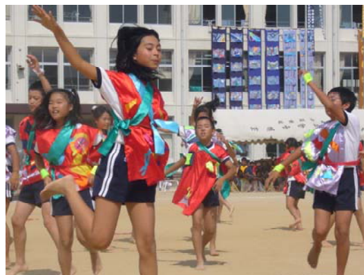
附属小学校うれしのカーニバル （関連記事 10 ページ）