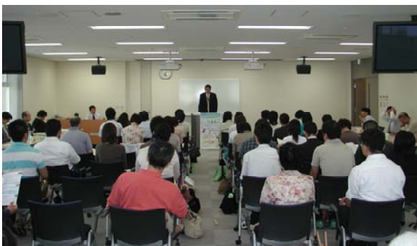
キャンパス・イノベーションセンター(大阪市)