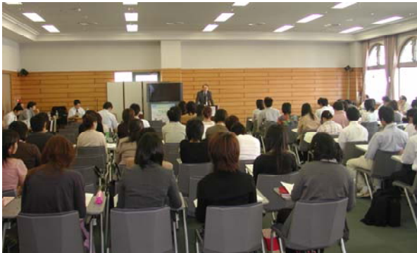
大学院神戸サテライト

説明会では、大学院の概要説明等が行われた後、各コース・事務局ごとに設けられたテーブルで個別相談が行われ、予定の時間を超えて熱心な質疑応答が行われた。