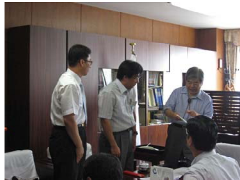
韓国大邱教育大学校大学院生来学 (関連記事 4 ページ)