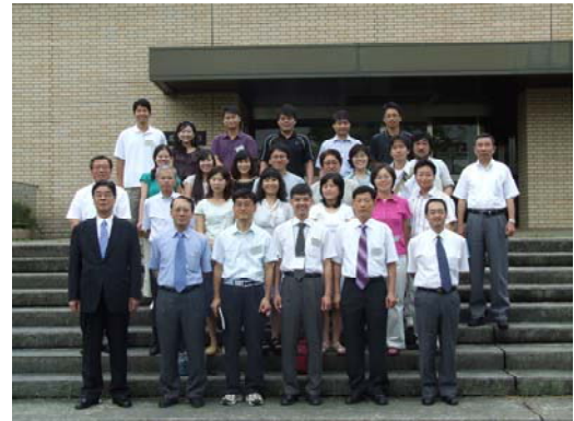
韓国京仁教育大学校大学院生来学 (関連記事 5 ページ)