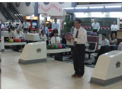
全学レクリエーション「ボウリング大会」の始球式 （関連記事 7 ページ）