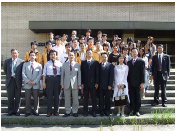
中国・広東省学生訪問団が本学を訪問（関連記事 5 ページ）