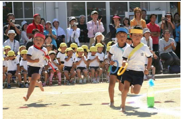
附属幼稚園運動会（関連記事 6 ページ）