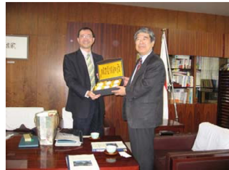
台湾教育部高等教育司長らの訪問（関連記事 6 ページ）