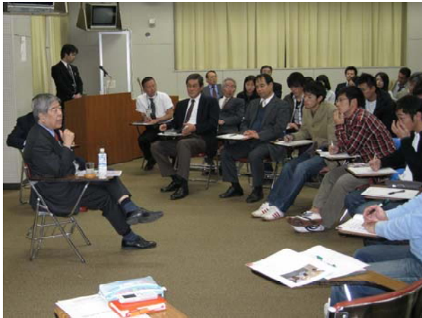
全学教職員会議（学長対話集会）（関連記事 8 ページ）