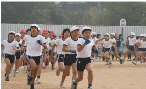
附属小学校第29回マラソン大会（関連記事 8 ページ）