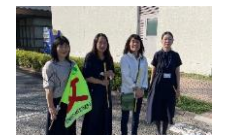
駐車場整理ありがとうございます