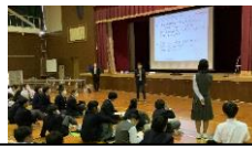
10/25 1年総合学習(もち麦)