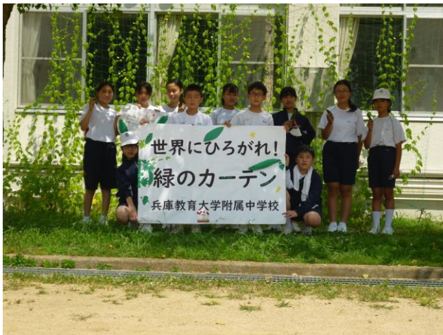
緑のカーテン前で記念写真