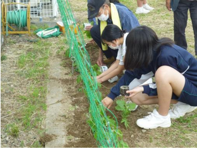
ゴーヤの苗を植える様子

緑のカーテンは、日差しをさえぎり、植物の葉の働き（蒸散作用）により、まわりの温度を下げることができます。これにより、エアコンなどの電力を節約し、地球温暖化の原因といわれる二酸化炭素 \text{CO}_2 を減らすことができます。ご協力をいただきました皆様に感謝申し上げます。自然の恵みに感謝し、これからも自然環境を守る取り組みを続けます。