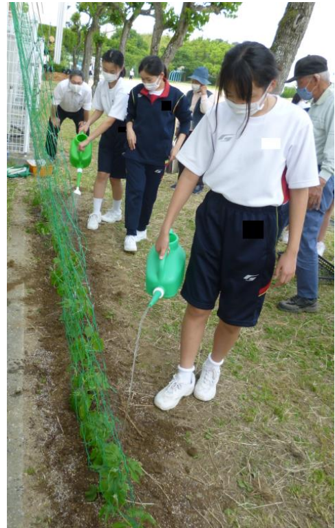
水やりを行う様子