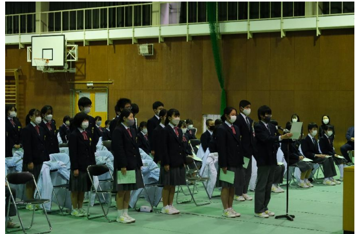
立志宣言（決意表明）の様子