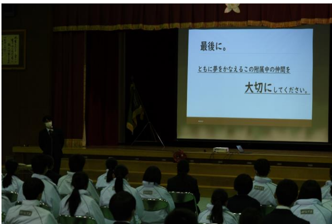
記念講演会の様子