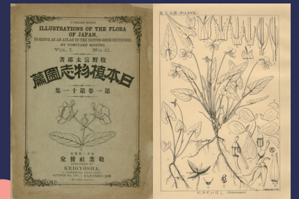
日本植物志図篇 / 敬業社