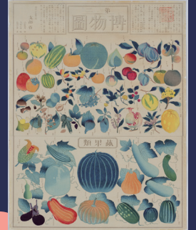
第二博物図（復刻軸）/ 文部省