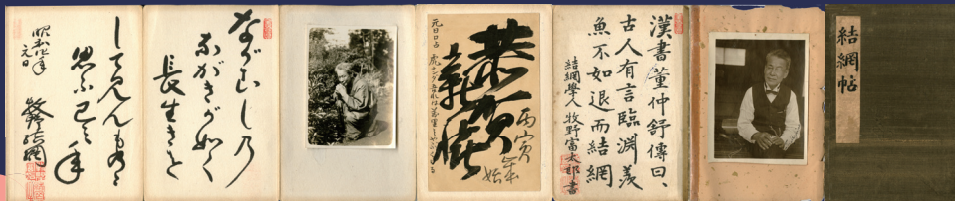
結網帖 / 牧野富太郎