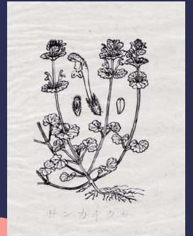
サンガイグサ原図 / 牧野富太郎